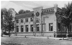
Пермь. Дом губернатора

В межреволюционный период в полной мере раскрывается публицистический талант и энергия П.Б. Струве как редактора влиятельных общественно-политических изданий. С 1906 по 1918 год он редактирует журнал «Русская мысль»; выступив еще в 1902 году инициатором известного сборника «Проблемы идеализма», он является активным участником знаменитых сборников «Вехи» (1909) и «Из глубины» (1918). В 1913 году Струве защищает магистерскую диссертацию, в 1917 году — докторскую. Он — профессор экономики в Санкт-Петербургском политехническом институте; весной 1917 года избирается действительным членом Академии наук по отделу политэкономии.